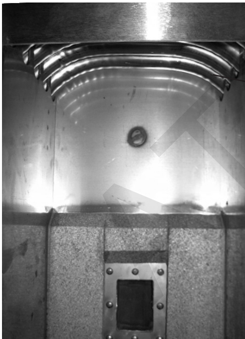
Tubos de intercambio superior